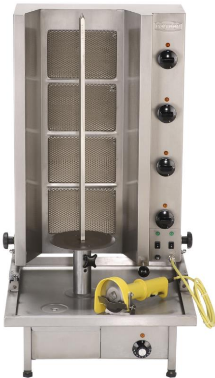
Serie „Poly Gas“