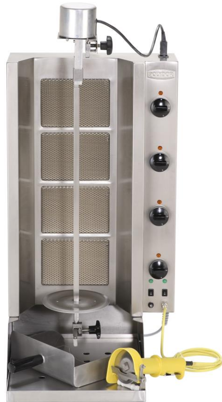
Serie „GAS G“

Die Gas-Grillgeräte eignen sich zum Herstellen von Gyros, Döner-Kebab sowie Shoarma. Sie sind geeignet für den Einsatz in Restaurants, Imbissen, Kantinen, Küchen und in mobilen Verkaufsfahrzeugen. Der Grillvorgang erfolgt mittels Infrarot-Gasstrahler. Die Heizleistung wird mittels eines Viertaktschalters geregelt. Das vertikal gespießte Fleisch wird durch einen Antrieb, welcher sich je nach Geräteserie über bzw. unter dem Grillgerät befindet, so gedreht, dass es während der Grillperiode durch die Drehbewegung gleichmäßig gebräunt wird.